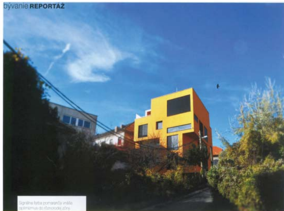
Signálna farba pomaranča vnáňa optimálnu do atmosféry zóny.