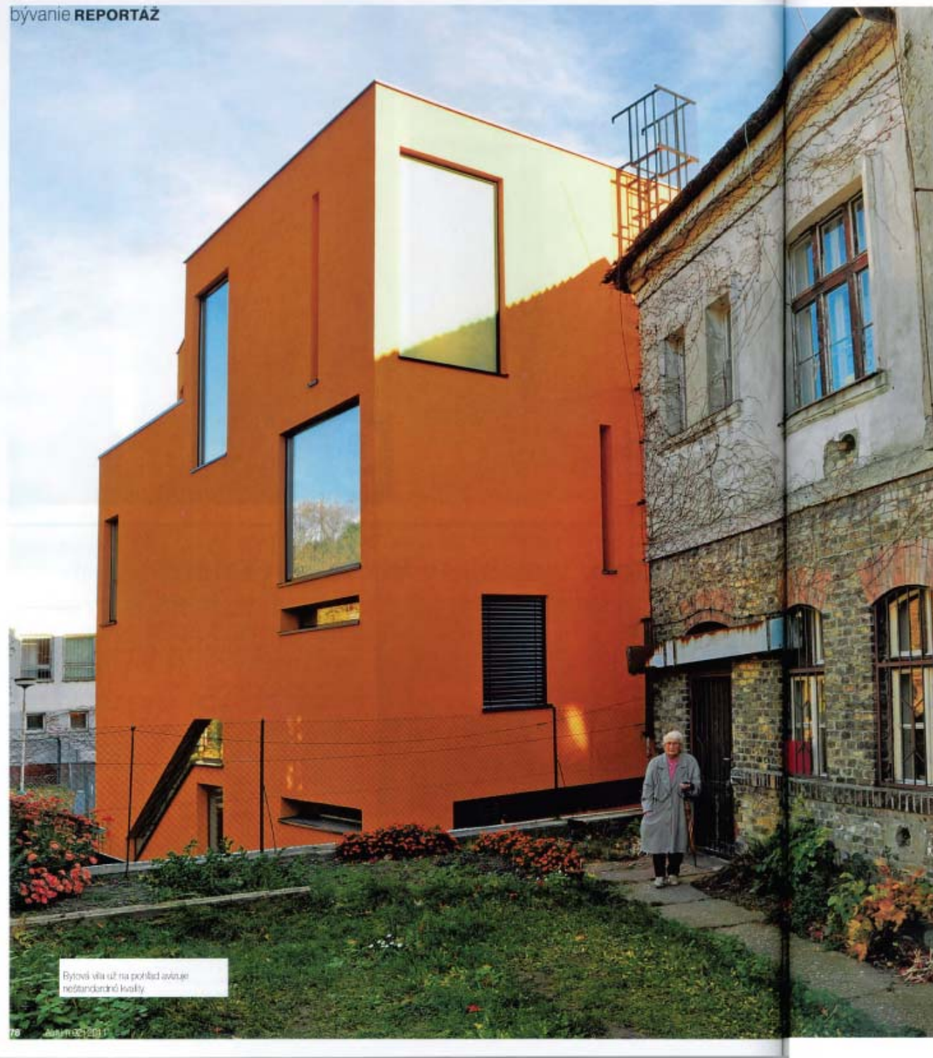
Býtová vila už na pohľad avizuje neštandardnú kvalitu.