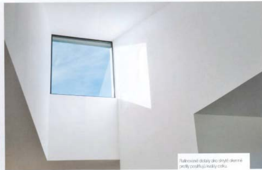
Ratnované detaily ako skrytý okenné prvky posúvajú kvalitu celku.