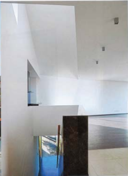
Na najvyšších podlažiach sa rozprestiera dvojpodlažný byt.