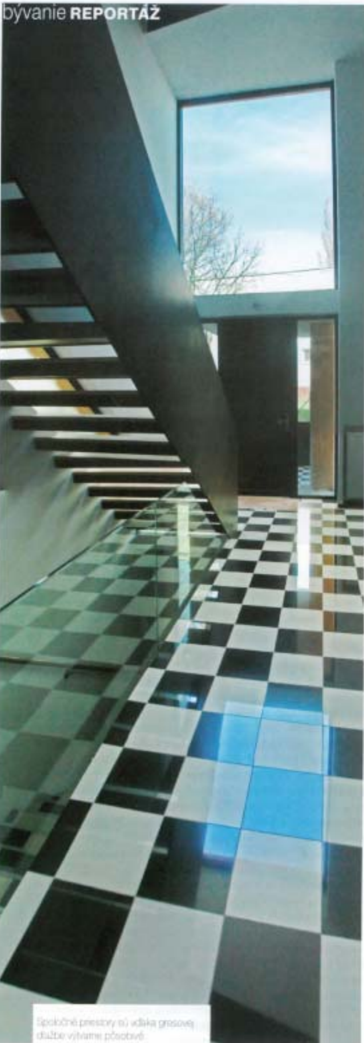
Spoločné priestory sú vďaka gresovej dlažbe výtvarem pôsobivé.