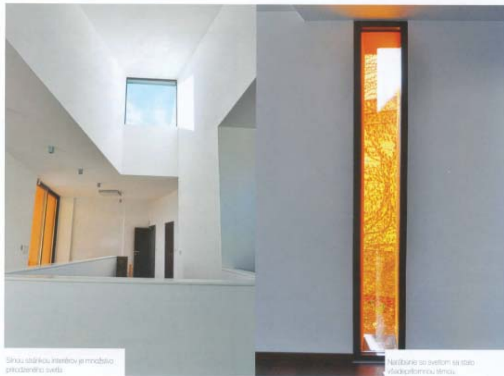
Sínou stárikou interiérov je množstvo prirodzeného svetla