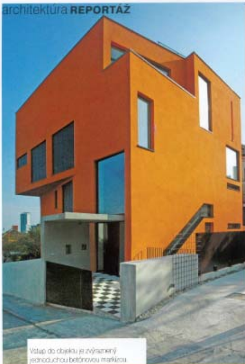
Vstup do objektu je zvýšený jednoduchou betónovou markízou